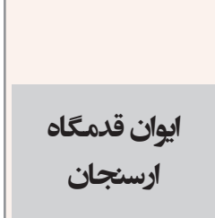
ایوان قدمگاه ارسنجان