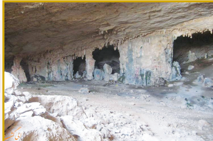
غار گبر استهبان