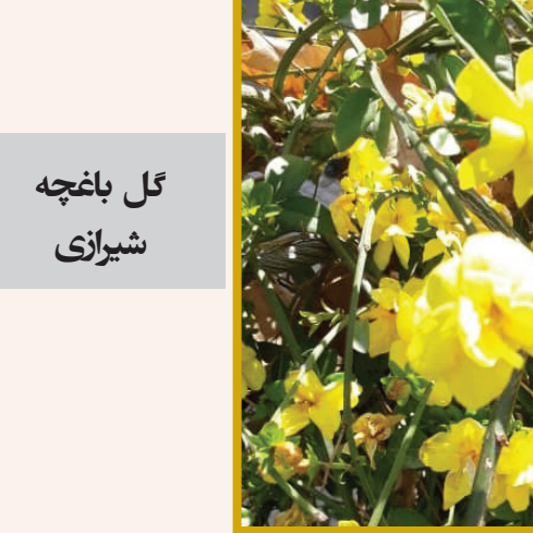
گل باغچه شیرازی