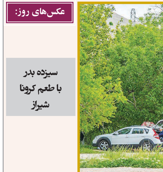
سیزده بدر با طعم کرونا شیراز

عکس‌های روز: سیزده بدر با طعم کرونا شیراز این پژوهشگر جشن‌های ایرانی در ادامه یادآور شد: جشن‌های ایرانی همچون سیزده‌بدر که پیوند ناگسستی با طبیعت دارند، یکی از سرمایه‌های نمادین ملی و در خدمت توسعه پایدار فرهنگی، اجتماعی و اقتصادی کشور هستند؛ اما برگزاری این جشن‌ها نیز باید با رعایت حرمت و حریم طبیعی در راستای توسعه پایدار انجام شود، در غیر این صورت نه تنها یکی از شاخص‌های توسعه نخواهد بود که برعکس به عامل رکود جامعه و تخریب محیط‌زیست کشور تبدیل خواهند شد.