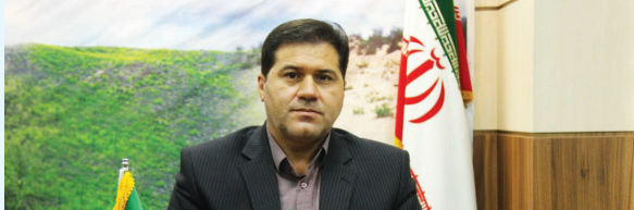
مدیرکل منابع طبیعی و آبخیزداری استان فارس خیر داد؛

اجرای طرح مقابله با حریق در فارس تشکیل ستاد اطفای حریق درکل استان