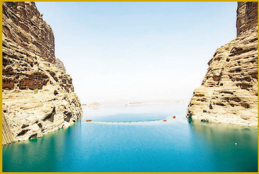
کاهش شدید حجم آب سد دز خوزستان