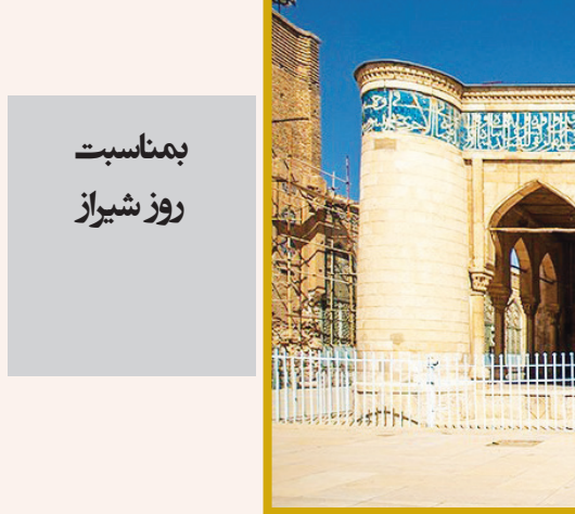
پمناسبت روز شیراز