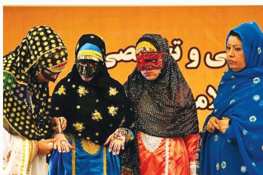
ازدواج این کار را می‌کردند. برخی از این خال کوبیها جنبه زیبایی و برخی دیگر جنبه درمانی داشته است.