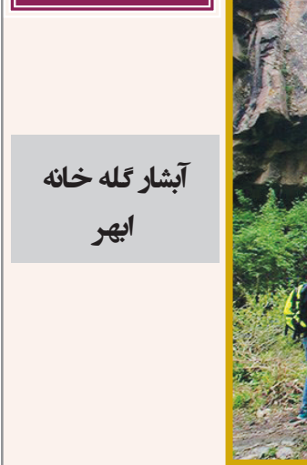
آبشار گله خانه ابهر