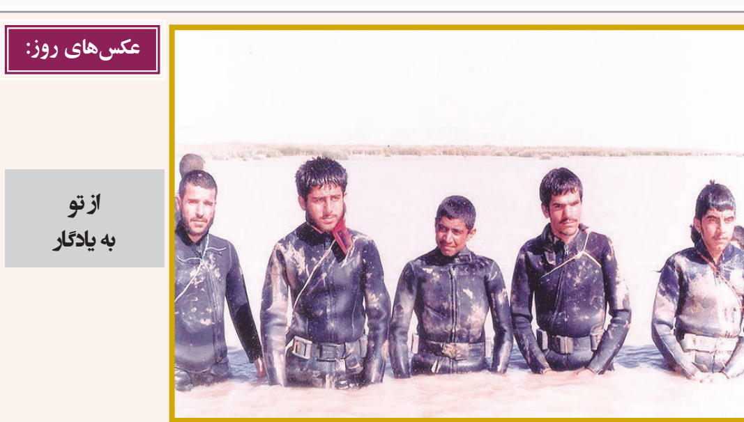
عکس‌های روز: از تو به یادگار