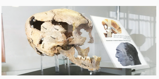
هم فکر نکنیم اما سالها طول کشیده تا انسان نخستین به ابزارهای خراشنده برسد!

در کنار دستاوردهای بشر برای رفاه زندگی اش، سیر باورها و اعتقاداتش هم در موزه مشاهده می شود. در دوره های اولیه پیکرکها را می بینید و هر چه به انتهای موزه نزدیک می شوید، نقش و نگارهای اساطیری روی آثار بیشتر می شود که شامل نقوش آیینی و اعتقادی هم می شود. همچنین می بینیم که تزیینات از نقوش گیاهی و طبیعی به سمت حیوانی و در انتها نقوش انسانی می روند.