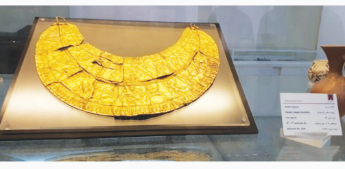
موزه ایران باستان، امروزه بخشی از مجموعه موزه ملی است که به اشیای دوران پیش از اسلام تعلق دارد. این موزه در سال ۱۳۱۶ به عنوان اولین بنای موزه ای کشور افتتاح شد. پیش از موزه ایران باستان، کاخ ایبض در مجموعه کاخ گلستان تبدیل به موزه شده بود اما از ابتدا ساختمان آن را با هدف موزه نساخته بودند؛ بنابراین، موزه ملی اولین بنایی بود که به عنوان موزه ساخته شد.

این موزه، تمام آثار هر دوره و سلسله تاریخی را شامل نمی شود و فقط تعدادی از آثار هر دوره و منطقه در آن جای گرفته. با بازدید از موزه ایران باستان کلیتی از دوره های تاریخی و سبک آثار هر منطقه در ذهنانتان می نشیند و برای دیدن آثار بیشتر می توانید به موزه های تخصصی هر منطقه مراجعه کنید. مثلاً، از هخامنشیان آثاری وجود دارد اما بیشتر آثار در خود تخت جمشید و موزه آن هستند.