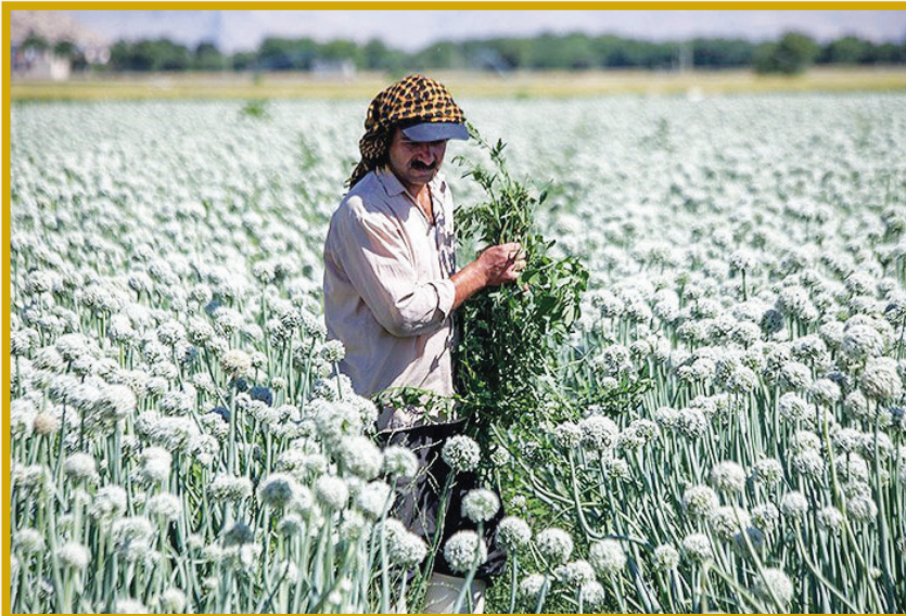
مزرعه پیاز بذری کومانشاه