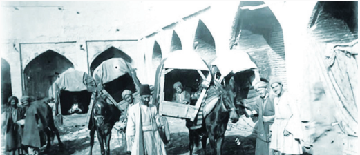
پالکی و کجاوه

پالکی و کجاوه هر دو دارای دو صندوق بدون در بودند که دو طرف شتر یا قاطر بسته می‌شد؛ روبات آن را پالکی و نوع مسقف را کجاوه می‌نامیدند.