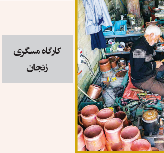
کارگاه مسگری زنجان