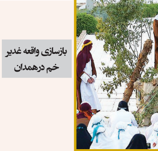
بازسازی واقعه غدیر خم در همدان