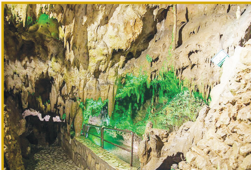
غار قوری قلعه در کرمانشاه