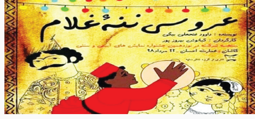
مردی طمع کار و پول‌پرست است قصد دارد با ننه غلام ازدواج کند