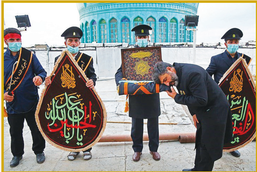
آیین تعویض پرچم گنبد مسجد جمکران