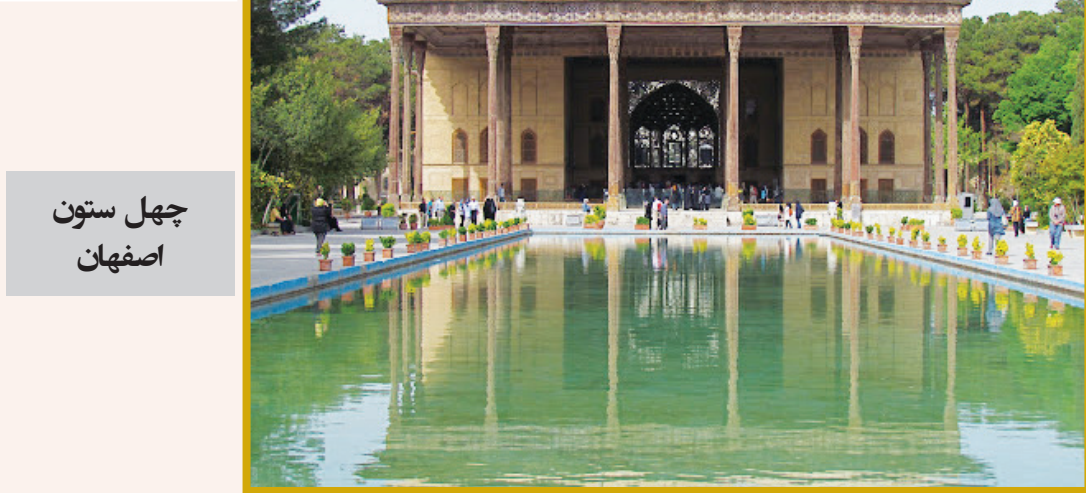
چهل ستون اصفهان