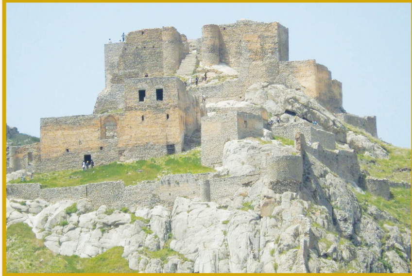
قلعه بابک خرمدین آذربایجان شرقی