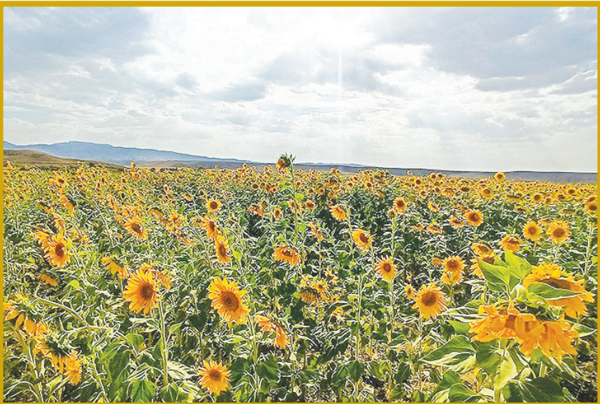
مزارع گل آفتابگردان در ناکستان قزوین