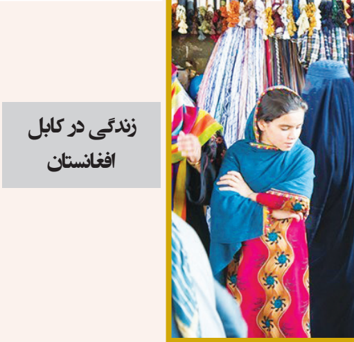
زندگی در کابل افغانستان