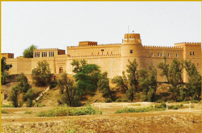
کاخ آپادانای شوش قصر زستانی شاهان هخامنشی