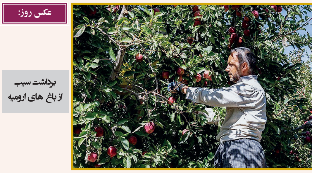
عکس روز: برداشت سیب از باغ های ارومیه

شهریور از کسی بدت می‌آید، این سوءتفاهمی است که باید به‌سرعت برطرف شود چون او نقش مهمی در سرنوشت عاطفی تو خواهد داشت. پس با هشیاری از وقوع یک اشتباه جلوگیری کن، زیرا این وضعیت به ضرر تو خواهد بود.