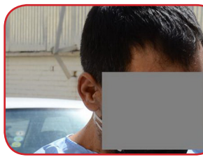
فرمانده انتظامی لارستان از دستگیری یک نفر از ارادل و اوپاش ملقب به ستار چهل تیکه در این شهرستان خبر داد. به گزارش دریافتی روزنامه به نقل از پایگاه خبری پلیس، سرهنگ داود امجدی در تشریح جزئیات این خبر افزود: در پی ارجاع یک فقره نیابت قضائی از دادسرای عمومی و انقلاب شهرستان جهرم مبنی بر جلب متهم ملقب به ستار چهل تیکه به اتهام ایراد ضرب و جرح عمدی با سلاح گرم، حمل و نگهداری اسلحه غیرمجاز جنگی از نوع کلاشینکف و قدرت‌نمایی با سلاح و همچنین اختلال در نظم عمومی مراتب به صورت ویژه در دستور کار کارشناسان پلیس امنیت عمومی این شهرستان قرار گرفت.

وی افزود: کارشناسان پلیس امنیت عمومی لارستان با اشراف اطلاعاتی و اقدامات فنی موفق شدند متهم در حالی که با یک سواری پژو پارس در محور مواصلاتی این شهرستان در حال تردد بود را شناسایی و وی را در یک عملیات غافلگیرانه دستگیر کنند. فرمانده انتظامی «لارستان» با بیان اینکه در سوابق متهم جرایمی از جمله قدرت‌نمایی با سلاح، اختلال در نظم عمومی، ایراد ضرب و جرح و حمل و نگهداری اسلحه به چشم می‌خورد، عنوان داشت: این فرد ارادل و اوپاش برای سیر مراحل قانونی تحویل پلیس امنیت عمومی شهرستان جهرم شد.