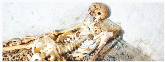
باستان‌شناختی پمپئی، این اکتشاف استثنایی است چون تصویری نایاب از حقیقت زندگی مردم به دست می‌دهد، تصویری که معمولاً

باستان‌شناسان با کشف اتاق بردگان در یک ویلا در حومه شهر سوخته پمپئی، از حقیقت زندگی مردمان عادی در دوران رم باستان پرده برداشتند. به گزارش خبرنگار فرهنگی ایسنا از روزنامه گاردین، باستان‌شناسان ایتالیایی از کشف اتاقی محقر که محل زندگی بردگان بود در حومه شهر باستانی پمپئی خبر دادند. در این اتاق کوچک که در ویلایی بزرگ در ۷۰۰ متری شمال غرب دیوارهای شهر پمپئی کشف شده، سه تخت چوبی و یک صندوق چوبی حاوی اشیاء فلزی و پارچه‌ای به جا مانده است. این اکتشاف مهم حدود یک سال پس از آن به وقوع پیوسته که بقایای دو قربانی فوران آتشفشان کوه وزوو در همین ویلا کشف شد، اسکلت‌هایی که گفته می‌شد به یک ارباب و برده‌اش تعلق دارند. به گفته باستان‌شناسان یک پنجره کوچک در بالای اتاق تنها راه ورود نور به این اتاق ۱۶ متر مربعی بوده و هیچ نشانی از وسایل تزئینی روی دیوارها به چشم نمی‌خورد. به گفته گابریل زوکرتریول (Gabriel Zuchtriegel)، مدیر پارک باستان‌شناختی پمپئی، این اکتشاف استثنایی است چون تصویری نایاب از حقیقت زندگی مردم به دست می‌دهد، تصویری که معمولاً