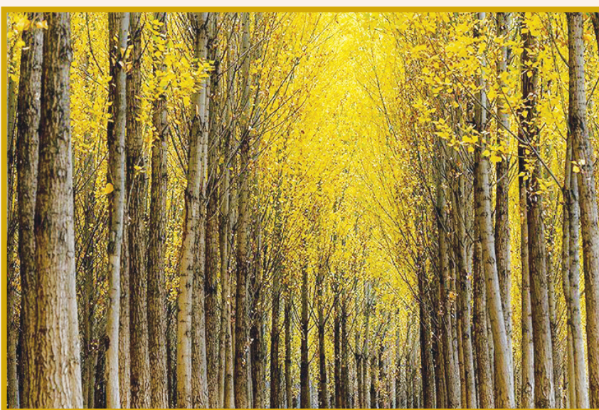
طبیعت پاییزی روستای کاسیان خرم آباد