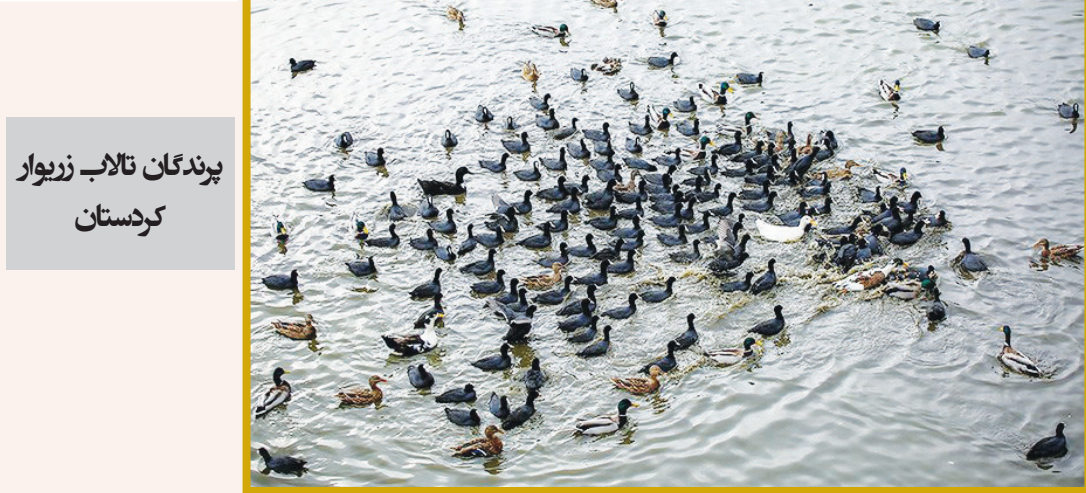
پرنده‌گان تالاب زیویار کردستان