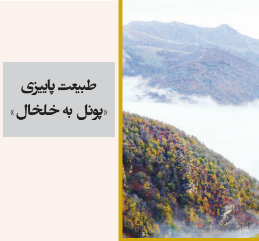
طبیعت پاییزی «پونل به خلخال»