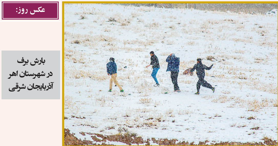
عکس روز: بارش برف در شهرستان اهر آذربایجان شرقی