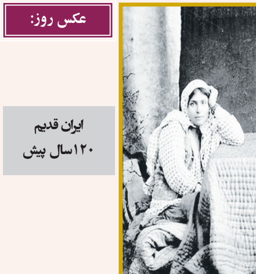
عکس روز: ایران قدیم ۱۲۰ سال پیش