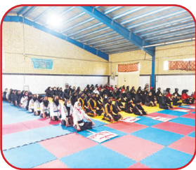
مسابقات بین سبکی بانوان کهگیلویه و بویراحمد با شناخت سبک ها و نفرات برتر در یاسوج برگزار شد.

به گزارش روزنامه طلوع به نقل از روابط عمومی اداره کل ورزش و جوانان استان کهگیلویه و بویراحمد، مسابقات بین سبکی بانوان کهگیلویه و بویراحمد با شناخت سبک ها و نفرات برتر در یاسوج برگزار شد. در این مسابقات انجمن توآ با ۶ طلا، ۸ نقره، ۱ برنز و ۳ سوم مشترک و مجموعاً ۸۳ امتیاز به مقام اول رسید. کونگک فوآزاد، ۷ طلا، ۶ نقره، ۲ برنز و ۱ سوم مشترک و مجموعاً ۸۱ امتیاز با ۸۲ امتیاز به مقام اول تیمی رسید، دوم تیمی را کسب کرد و آزان رزم ۳ طلا، ۳ نقره، ۳ برنز و ۲ سوم مشترک و ۵۳ امتیاز به مقام سوم رسید.