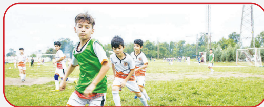
رئیس هیئت فوتبال گناوه گفت: باشگاه پرسپولیس این شهرستان با راه اندازی آکادمی فوتبال به پرورش بازیکنان بومی روی آورده است.

پرسپولیس گناوه سابقه حضور در لیگ های دوم و سوم را دارد.