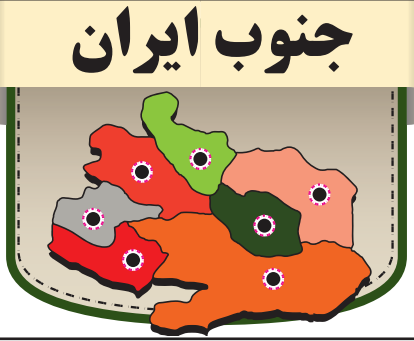
استان کهگیلویه و بویراحمد

به گزارش ایرنا، حجت‌الاسلام سید محمدعلی قاضی دزفولی در نشست شورای فرهنگ عمومی در دفتر امام جمعه ضمن تسلیت ایام فاطمیه و شهادت حضرت فاطمه (س) افزود: موسیقی در دزفول وضعیت نامناسبی دارد که لازم است