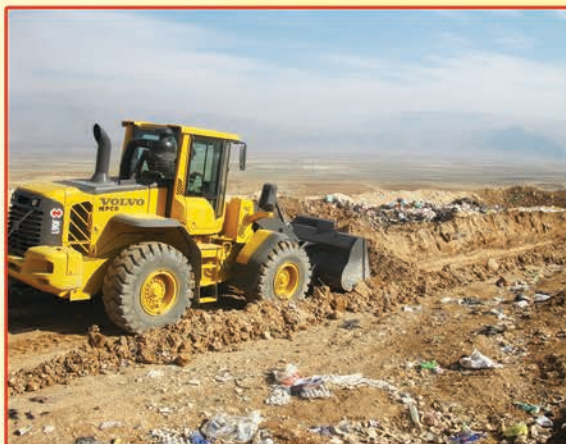
دفع بهداشتی پسماندهای شهری