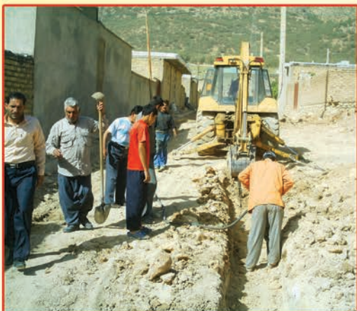
تعمیرات قسمت های فرسوده شبکه آب شرب