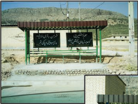
ساخت و نصب ایستگاه اتوبوس در محله شهر