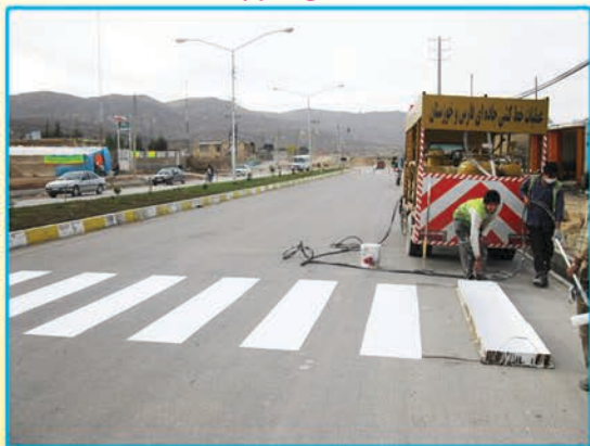
خط کشی عابر پیاده