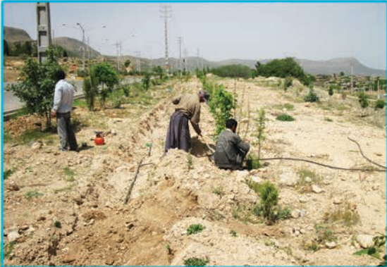
اجرای سیستم آبیاری قطره ای