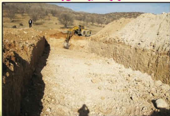
حشر تراشه جهت دفع پسماند