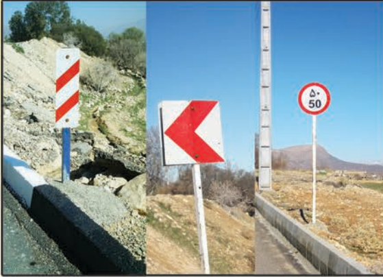
تهیه و نصب تابلوهای راهنمایی و راهنمایی