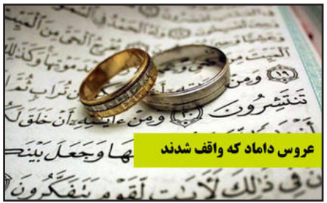
عروس داماد که واقف شدند

به گفته سرهنگ بابایی ماموران پلیس با هماهنگی مقام قضایی شهرستان تحقیقات خود را آغاز کرده و با بکارگیری شگردهای پلیسی از صحت موضوع مطلع شدند. وی ادامه داد: بلافاصله با اخذ استعلامات لازم از بانک مورد نظر با کارهای اطلاعاتی محل اختفای کارمند مذکور متواری شده شناسایی و دستگیر شد. سرهنگ بابایی در خاتمه اظهار داشت: متهم در بازجویی اولیه به اختلاس مبلغ یاد شده اقرار کرد و با تشکیل پرونده به مراجع قضایی معرفی و به جرم اختلاس روانه زندان شد. شهرستان گراش در ۳۵۵ کیلومتری جنوب شرقی شیراز قرار دارد.