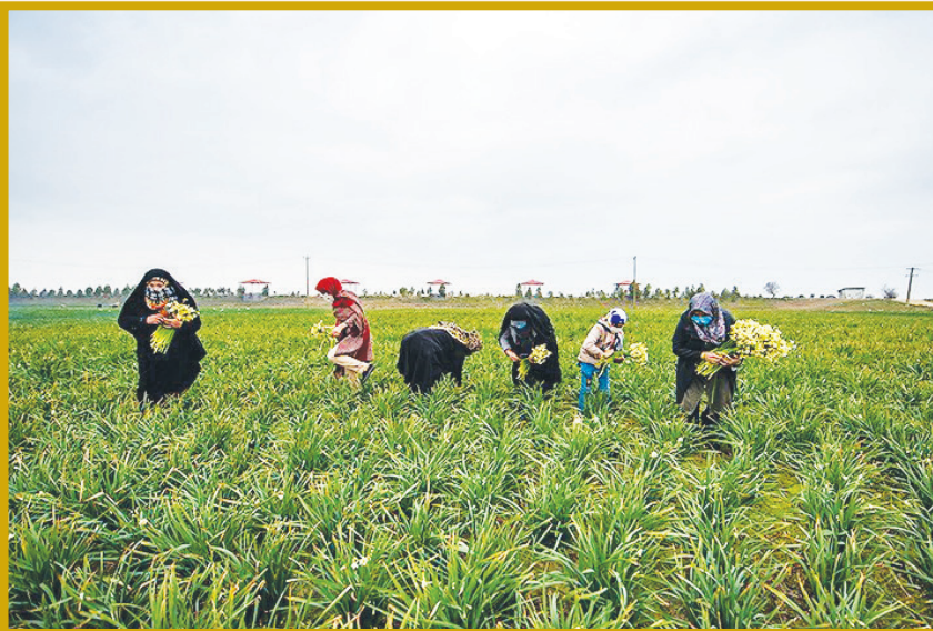
برداشت گل نرگس از مزارع ملازندان