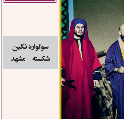
سوگواره نگین شکسته - مشهد