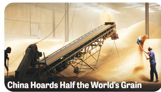
China Hoards Half the World's Grain

او افزود: بر همین اساس درآمد حاصل از جذب گردشگران ورودی به کشور صادرات تلقی شده و این معافیت مشمول آن‌ها می‌شود. این موضوع یکی از چالش‌هایی بود که از سال‌های گذشته به علت تفاسیر گوناگون، فعالان این حوزه را با چالش روبه‌رو کرده بود که با تصویب و اجرای شدن قانون جدید مالیات بر ارزش افزوده مرتفع می‌شود. شالیان‌افان در پایان بر هماهنگی با دستگاه‌های ذیربط تأکید کرد و گفت: