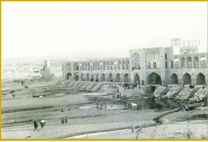
اصفهان ۴۰۰ سال پیش