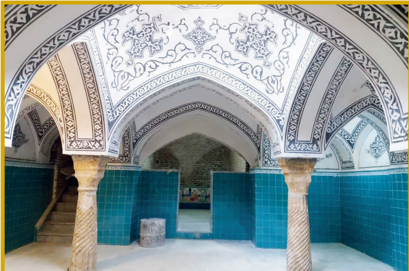
حمام تاریخی محله «کلبیان» همدان