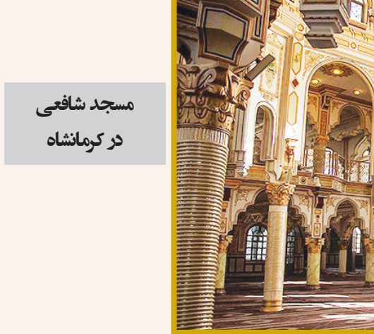
مسجد شافعی در کرمانشاه