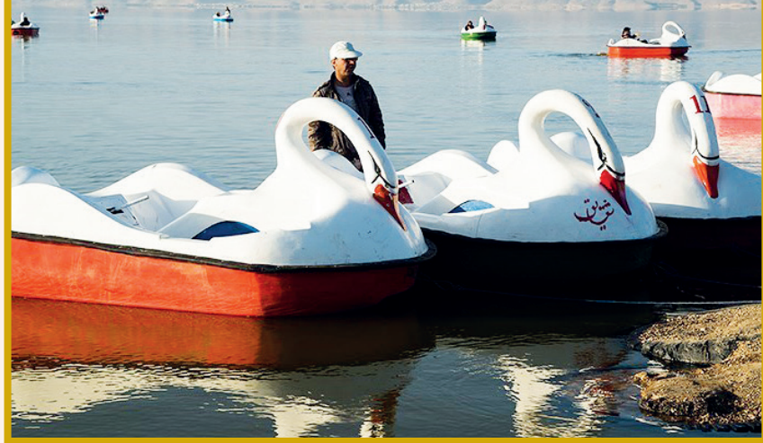
آبگیری دریاچه مهارلو - شیراز