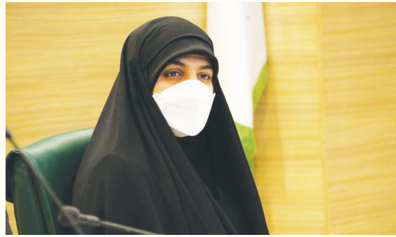
وی گفت: جلسات سرمایه‌گذاری باید بیانگر مشکلات سرمایه‌گذاران باشد تا راهکارهای مناسب مشکلات آنان اندیشیده شود. ایجاد پنجره واحد اولین گام برای جذب سرمایه‌گذار است