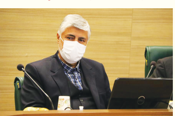
علیرضا پاک فطرت نماینده مردم شیراز و زرقان در مجلس شورای اسلامی در پتل بررسی مشکلات و چالش‌های پیش روی سرمایه‌گذاران گفت: اداره کلانشهرها بدون مشارکت بخش خصوصی و سرمایه‌گذاران ممکن

وی افزود: تمام دستگاه‌های اجرایی دارای سامانه شده‌اند اما هیچ کدام از این سامانه‌ها نمی‌توانند تبادل اطلاعات با یکدیگر داشته باشند و جزیره‌ای عمل می‌کنند. دایی با اشاره به اینکه باید به شیوه الکترونیکی پنجره واحد را ایجاد کنیم، گفت: این پنجره واحد باید در سطح ملی ایجاد شود. همچنین در حال تهیه اطلس سرمایه‌گذاری هستیم تا جهت سرمایه‌گذاری مشخص شود. اداره کلانشهرها بدون مشارکت سرمایه‌گذاران ممکن نیست