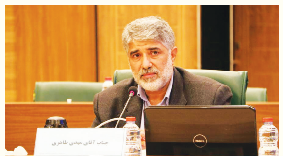
رئیس شورای اسلامی شهر شیراز در نشست ایجاد پنجره واحد سرمایه‌گذاری گفت: تشکیل این پنجره واحد مربوط به چارچوب اصلی سرمایه‌گذاری است که باید دو طرف در قرار داد سرمایه‌گذاری به فهم مشترک برسند.

نشست برون رفت از چالش‌ها و توسعه سرمایه‌گذاری در شهر شیراز با حضور جمعی از نمایندگان شیراز در مجلس شورای اسلامی، رئیس و اعضای شورای اسلامی شهر، شهردار شیراز، مدیران شهری و فعالان حوزه اقتصاد و سرمایه‌گذاری برگزار شد. سرویس خبری /خدیجه غضنفری: چهار پتل تخصصی این نشست شامل بررسی مشکلات و چالش‌های پیش روی سرمایه‌گذاران، لحاظ ریسک در بسته‌های سرمایه‌گذاری و تسهیم ریسک در قراردادهای مشارکتی، ایجاد پنجره واحد سرمایه‌گذاری و استفاده از ظرفیت استارت آپ ها و فناوری‌های نوین در سرمایه‌گذاری بود که طی آن مسئولان شهری با سرمایه‌گذاران و صاحبان فکر و اندیشه به بحث و گفتگو نشستند. آمادگی شورای اسلامی شهر برای حمایت از سرمایه‌گذاری