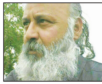
کیهان ژولیده انارکی