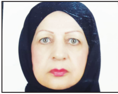
عشرت بنی هاشمی

درگیر غم و درد زمان هرسو بود هر لحظه به روی لب او باهو بود آن مرد علی بود که از پا ننشست آن مرد که روح صیقلی با او بود هر شب پر پرواز کبوترها بود یا اینکه شریک غم مادرها بود وقتی که نیامد همگی فهمیدند درگاه امید نیمه شب، مولا بود در عالم بچگی خود با پدری خوش بود که می‌داد به او بال و پری آن شب که پدر به او نزد سر، فهمید آن نخل کریم خم شده، بود علی دراوج و فرود، عشق مهمانش بود بخشش همه جا رفیق دستانش بود دنیای خودش سهم یتیمانش بود این‌ها همه از علی و ایمانش بود