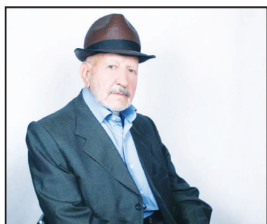
تهرانی نویندگانی «شاکر»

کوچه ای ساکت و کورم در آرزوی رهگذری حسّ سفری است در من اگر چه گوشه نشین خانه ای لبریز حرف‌های ناگفته‌ام مانده در سکوتی عمیق پيله ای هستم پر از پروانه‌های بی‌بال محکوم به مرگی آرام و زنده تنی دارم با چشم‌های دلتنگی که در من مانده است خیره به انتهای کوچه‌ی بن بست!