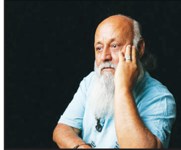
کیهان ژولیده انار کی