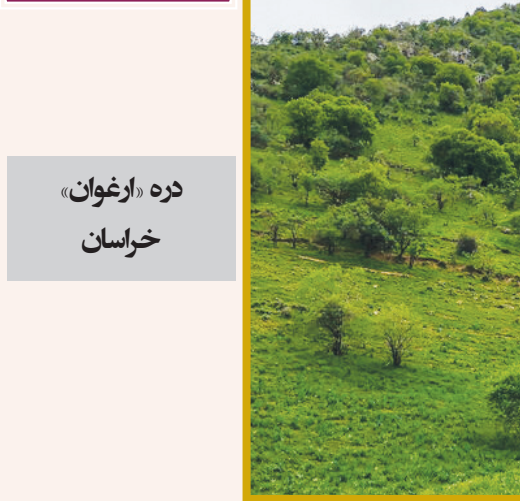
دره «ارغوان» خراسان