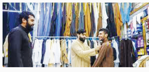
«سوگ الکویت» تا شب عید فطر شاهد حضور پرشور مردم هستند.

به گزارش مهر، مردم عرب خوزستان در روزهای پایان ماه رمضان و نزدیک به عید فطر دو رسم «ام الوسخ» و «ام الحلس» را برگزار می کنند. در روز «ام الوسخ» به معنای «روز چرکین» مردم این منطقه، خانه های خود را تمیز می کنند و با خرید اجناس جدید برای اکرام مهمانان آماده می شوند. روز بعد از «ام الوسخ»، «ام الحلس» است؛ نامی محلی و قدیمی از ایام رمضان که به معنای روز نظافت و رسیدگی شخصی است و جوانان در این روز به ظاهر خود رسیدگی می کنند. برای برگزاری این دو آیین در خوزستان، بازارهای شهرستان های مختلف از شوش تا روستاهای اطراف آن مانند «سرخه»، «چعب» و