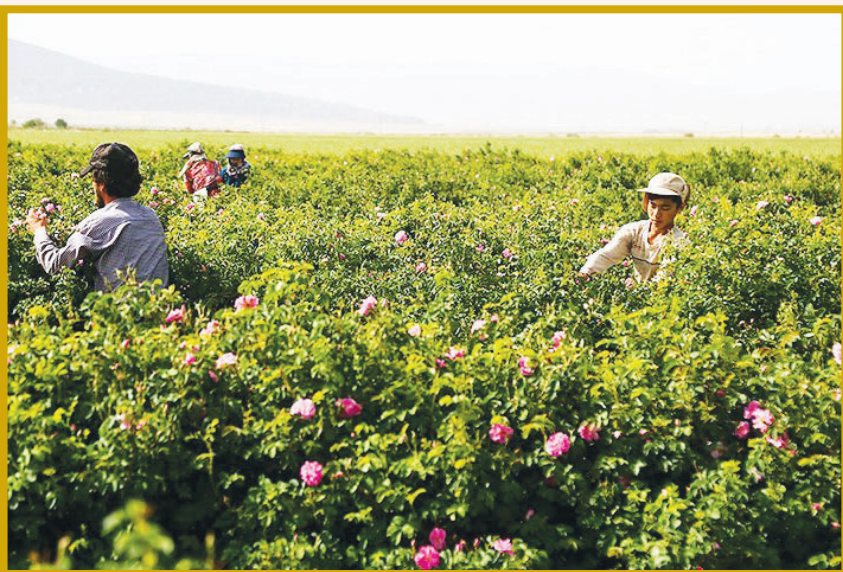
برداشت گل محمدی در قم