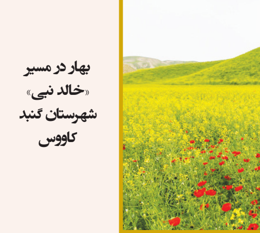
بهار در مسیر «خالد نبی» شهرستان گنبد کاووس